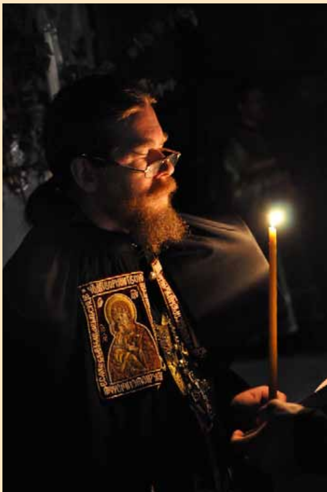
Архимандрит Тихон , наместник Сретенского монастыря, ректор Сретенской духовной семинарии