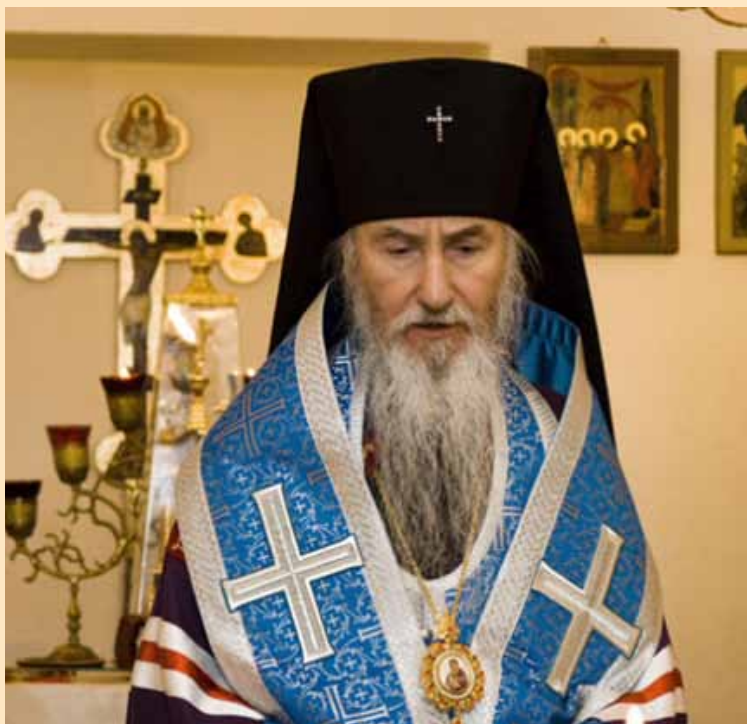
АРХИЕПИСКОП БЕРЛИНСКО-ГЕРМАНСКИЙ и ВЕЛИКОБРИТАНСКИЙ МАРК